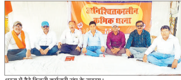
धरना में बैठे बिजली कर्मचारी संघ के सदस्य।

हरिभूमि न्यूज ►► कोरबा भारतीय मजदूर संघ से संबद्ध छत्तीसगढ़ बिजली कर्मचारी संघ महासंघ का अनिश्चितकालीन क्रमिक धरना प्रदर्शन लगातार जारी है। 12 अक्टूबर को आंदोलन के तृतीय दिवस पर बिलासपुर क्षेत्र के पदाधिकारी एवं सदस्य अपनी सक्रिय उपस्थिति दर्ज करा रहे हैं।