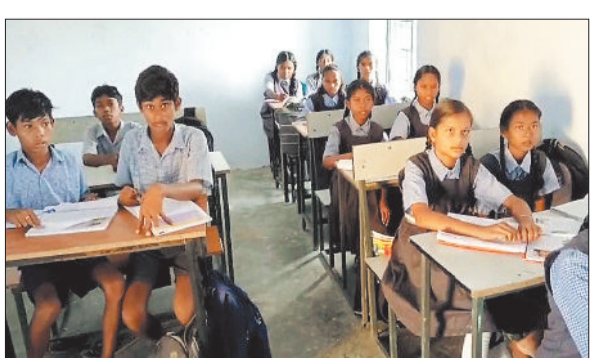
स्कूल में पढ़ते बच्चे।

हरिभूमि न्यूज ►► हरदीबाजार पाली विकासखंड अंतर्गत शासकीय पूर्व माध्यमिक शाला स्कूल अंडीकछार में कक्षा छठवीं से लेकर आठवीं तक 59 बच्चे पढ़ाई कर रहे हैं जहां के बच्चों को इंग्लिश एवं संस्कृत विषय की पढ़ाई नहीं हो पा रहा है। पाली ब्लॉक अंतर्गत अंडीकछार में अनुसूचित जनजाति एवं अनुसूचित जाति के बच्चे सहित सामान्य वर्ग के बच्चे यहां पढ़ाई कर रहे हैं जो बच्चे निम्न वर्ग के हैं जहां अंग्रेजी पढ़ाई एवं संस्कृत पढ़ाई से वंचित हो गए हैं। कक्षा