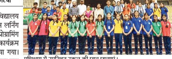
प्रशिक्षण में उपस्थित स्कूल की छात्र छात्राएं।