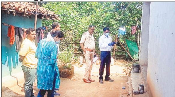
घटना स्थल पर जांच करती पुलिस एवं फॉरेंसिक एक्सपर्ट।

पेशे से ट्रक चालक ने किसी बात को लेकर अपनी पत्नी से कहासुनी हो गई और आवेश में आकर पति ने अपनी पत्नी की पहले गला दबाकर