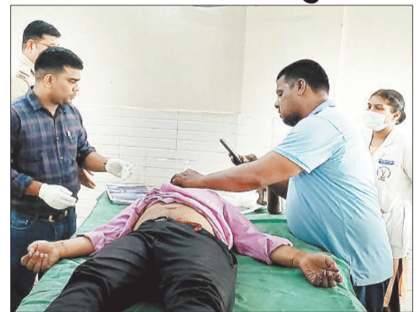
उपचार करते हुए चिकित्सक।